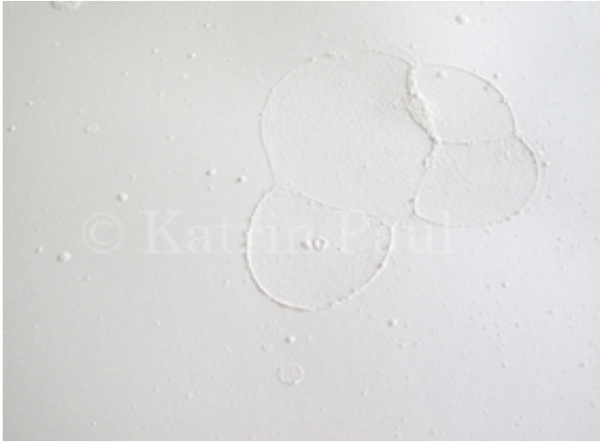
ぶつかる Aufgeschlagen © Katrin Paul <Paper, liquid soap, flour> 2011