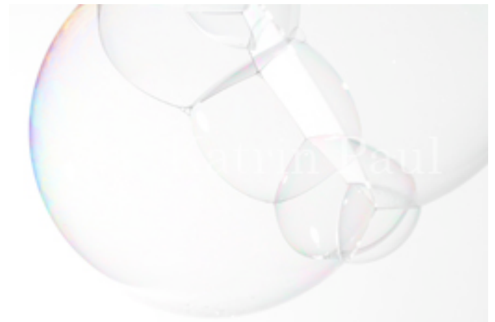
ふくらむ Aufgeblasen 2011