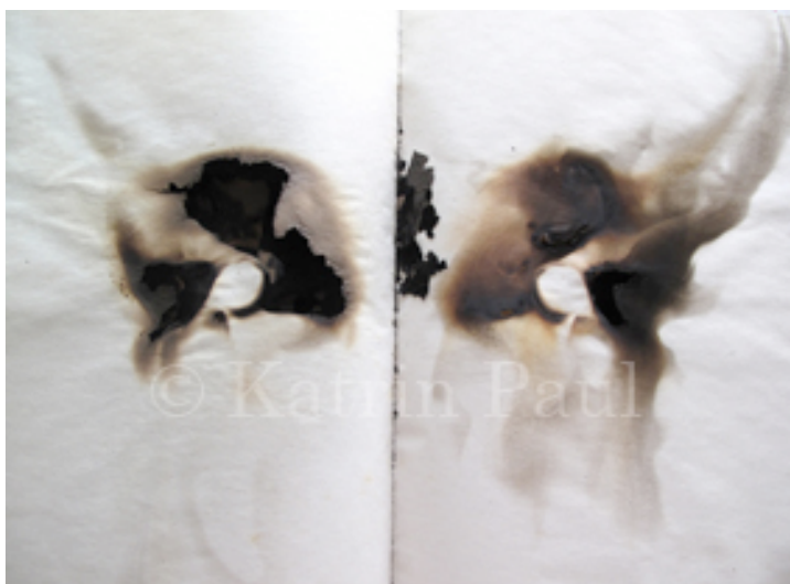
炎の本 Feuerbuch © Katrin Paul <Paper, firecracker, smut> 2008

日独交流150周年 Jahre Freundschaft Deutschland - Japan